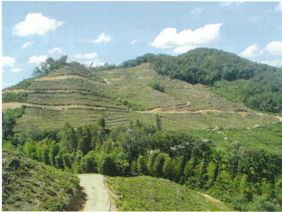
水源林造成事業 大平事業地（甲奴町福田）

令和4年11月15日に行いま した甲奴郡森林組合総代選挙 において、200名の総代を 選出して頂きました。組合員 の皆様の大変なるご理解ご協