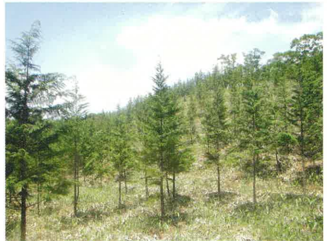
植林から10年が経過したヒノキ林（甲奴町）

庭木の伐採でよく1本からでも依頼できるのかといったお問い合わせをいただきますが、甲奴郡森林組合では1本からの伐採処分にも応じております。高くて手の届かない場所や、危険な場所など、ご自身で作業するのが困難な場合は、甲奴郡森林組合にお任せください。