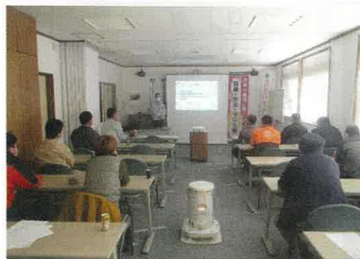
みんな熱心に聞いています