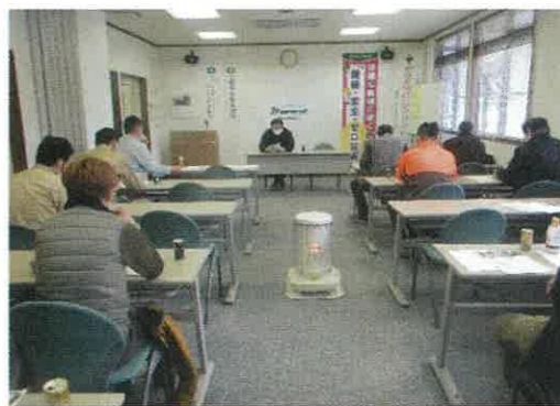
職員による安全指導