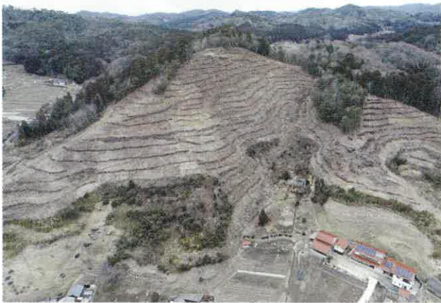
令和4年に整備した再造林地（上下町）

「伐って、使って、植えて、育てる」という森林環境の循環は、地域の生活環境を守り豊かな森林資源を次世代へ引き継いでいくことにつながります。森林整備のご相談や事業内容については、お気軽に森林組合へお問い合わせください。